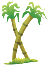
ईख Sugar cane